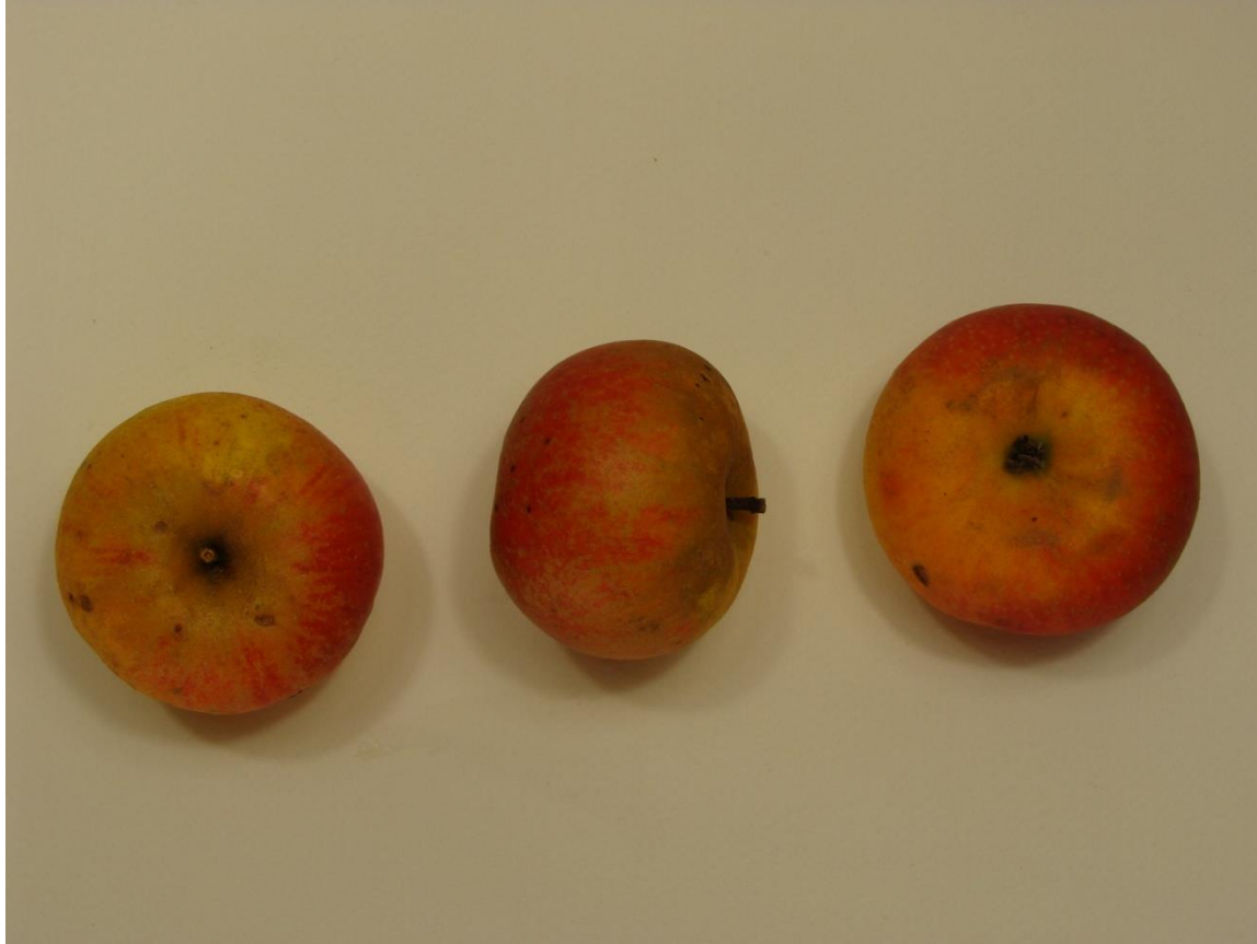
REINETTE de METZ